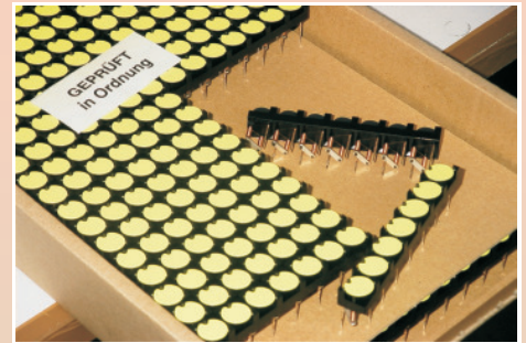
Dots Matrix Anzeige 15mm mit gelben Dots